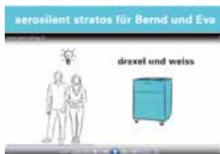
Erklärfilm: Komfortlüftung aerosilent stratos.